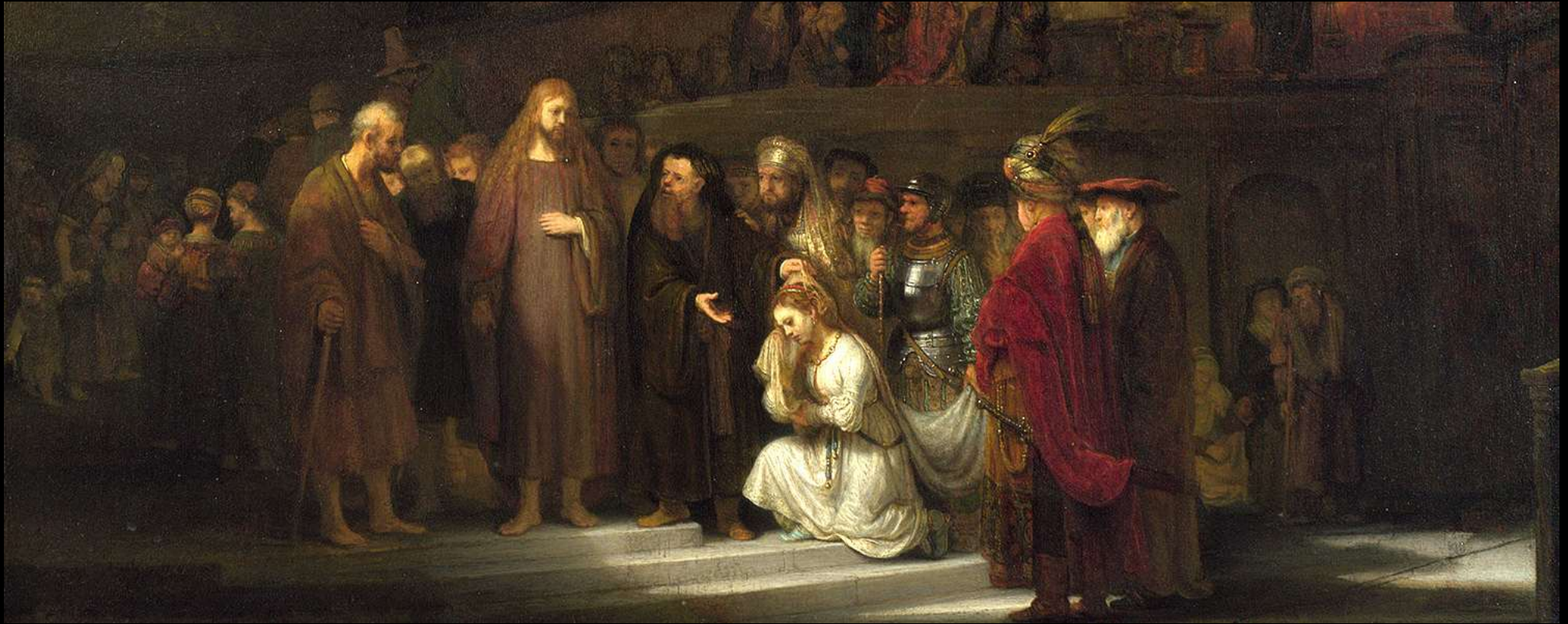
The Woman Taken in Adultery, Rembrandt, 1644 (cropped)