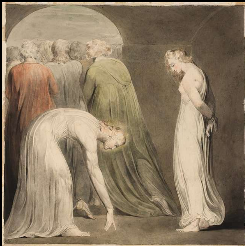
The Woman Taken in Adultery, William Blake, c. 1805