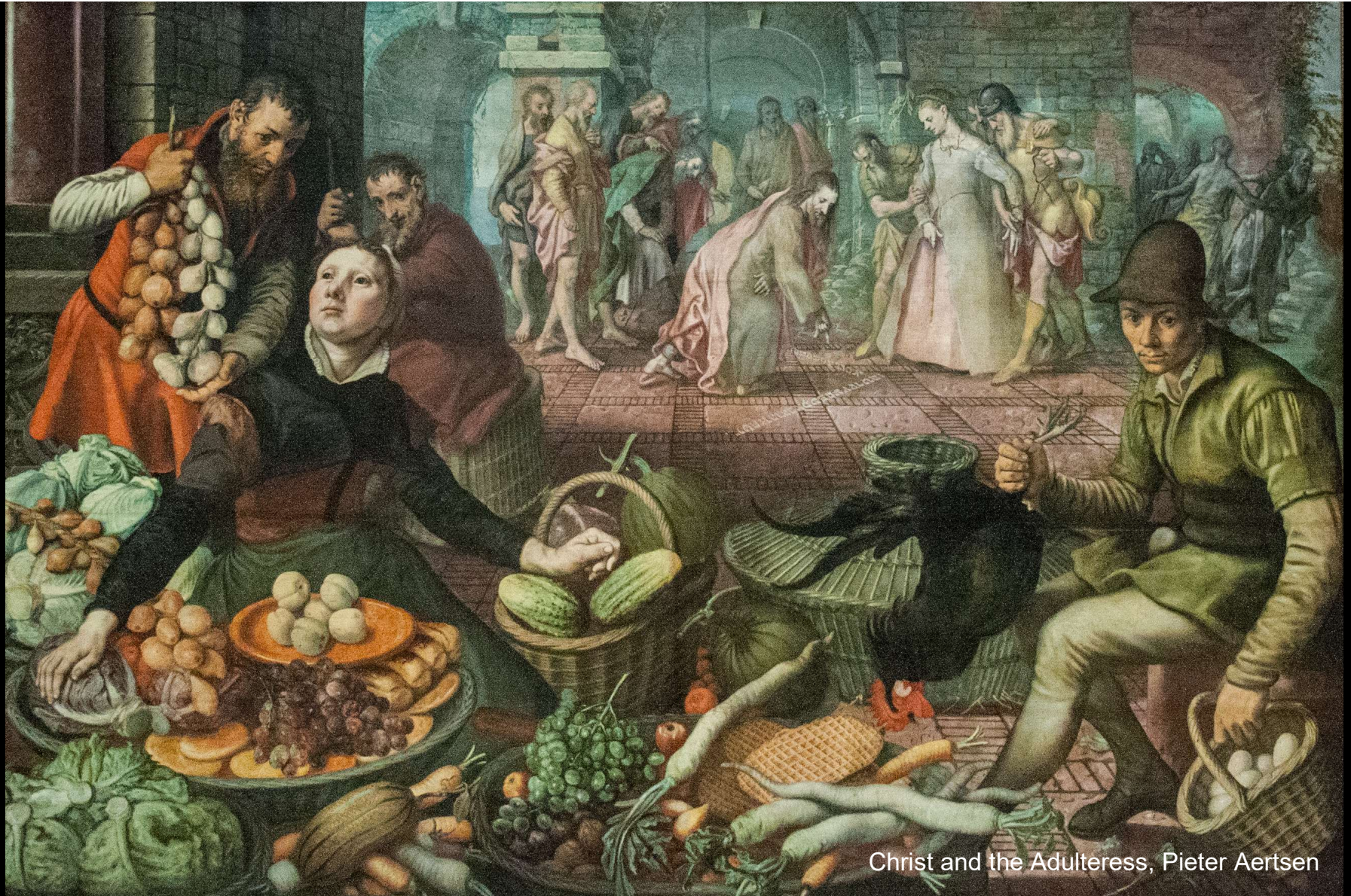
Christ and the Adulteress, Pieter Aertsen